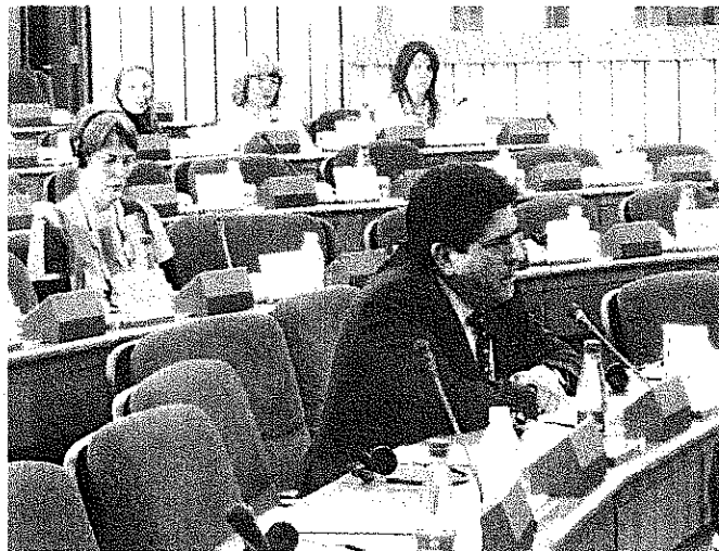
El Diputado Tomás Torres. Detrás, la eurodiputada Satu Hassi.

Por su parte, el Diputado mexicano, Tomás Torres (PVEM), destacó las iniciativas que ha impulsado el Partido Verde Ecologista de México dentro del Congreso mexicano, en materia medioambiental, para contar con un marco jurídico adecuado para contrarrestar los efectos del cambio climático.