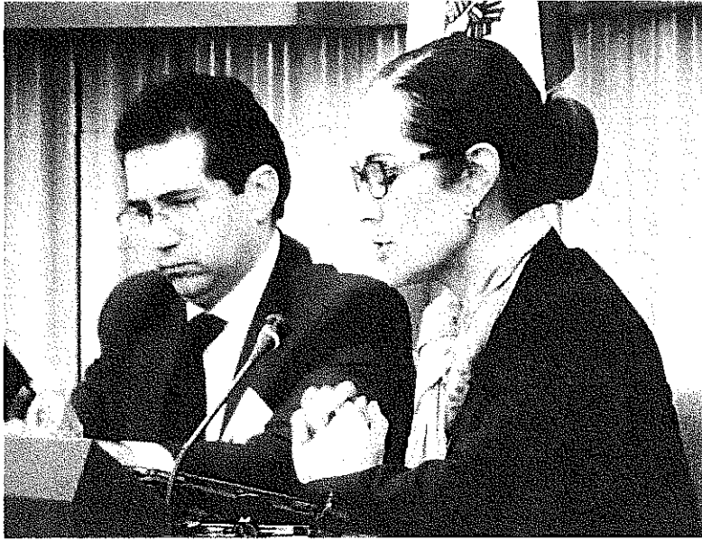
IMAGEN TOMADA DURANTE MI INTERVENCION EN EL TEMA DE LA LUCHA CONTRA EL COMERCIO ILICITO DE ARMAS

Tuve la oportunidad de participar en el tema de la lucha contra el comercio ilícito de armas, a continuación comparto mi exposición: