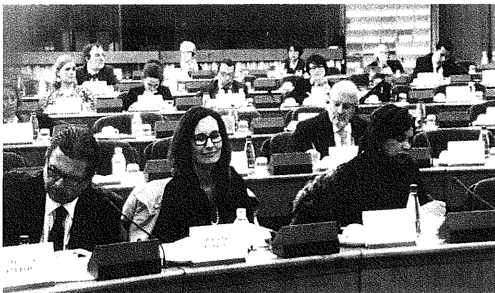
El senador Octavio Pedroza, la Diputada Rocío Reza y la Senadora Blanca Alcalá.

Destacó que también en los últimos años y meses la Unión Europea no ha dejado de mostrar progresos importantes. Croacia se incorporó al proyecto comunitario en julio de 2013 y Letonia entró a la Zona Euro en enero de 2014. La diputada Elzbieta también se refirió a los proyectos de resolución que se aprobarían al final de la legislatura del Parlamento Europeo, como el Reglamento para la Unión Bancaria y el Fondo de Resolución en caso de crisis. Señaló que existen retos importantes como el de la crisis de Ucrania, el desempleo juvenil y los pendientes que quedarán para la siguiente legislatura del Parlamento Europeo y para la nueva conformación de las instituciones comunitarias (una nueva Comisión y nuevo Presidente del Consejo Europeo).